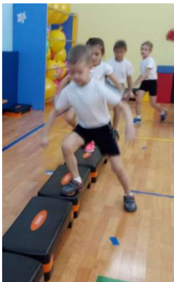
Степ-платформы, мячи фитболы, массажные мячи фитболы большие, мячи хоппы, гантели 500 гр.