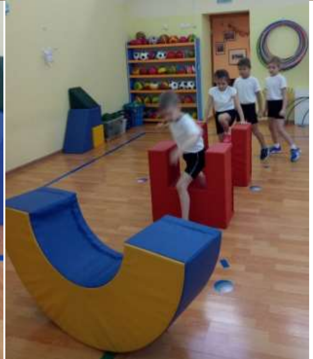
Большой комплект мягких красочных модулей.