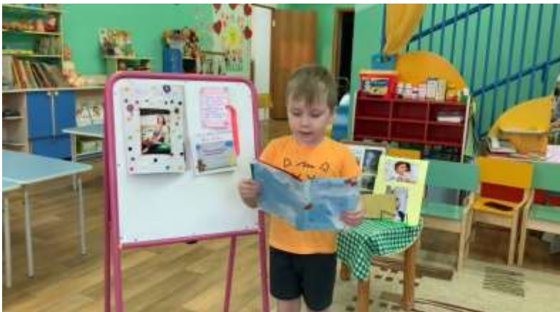
Видео-поздравление для мам.